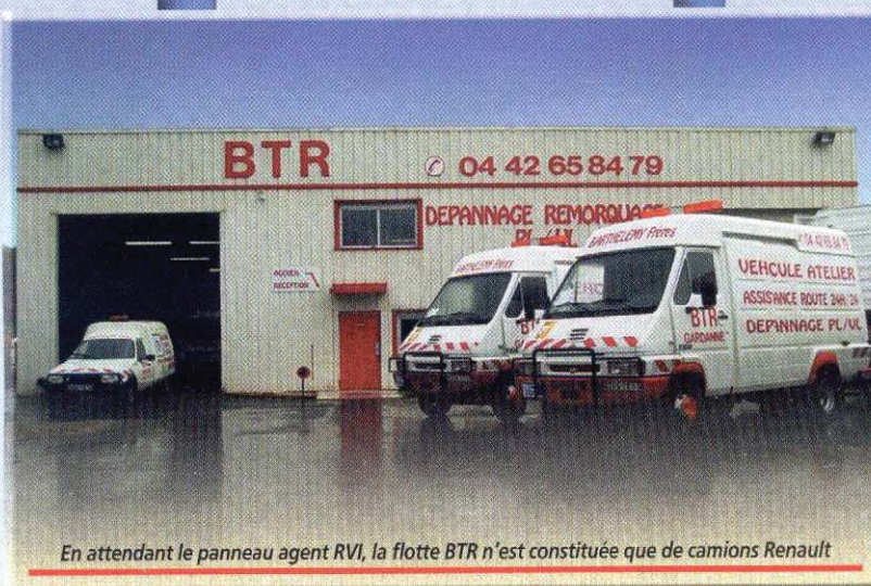
En attendant le panneau agent RVI, la flotte BTR n'est constituée que de camions Renault

Ci-contre à gauche : Ce 6x2 charge au panier. De taille respectable l'extension est à la hauteur de toutes les espérances. On peut regretter l'absence d'une poutre faisant office de grue.