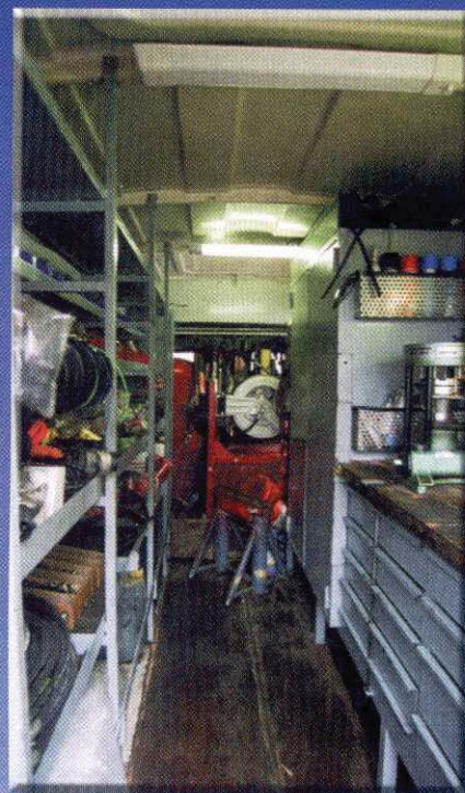
L'agencement exploite au maximum l'espace disponible. Remarquez la presse hydraulique sur l'établi.

Les dépanneuses Magnum ont toujours été difficiles à habiller. Ce modèle est très réussi avec des panneaux de chaque côté remontant très haut. Dommage que cela reste un habillage, il serait judicieux que le constructeur utilise la hauteur de son habillage pour en faire des coffres de grandes hauteurs.