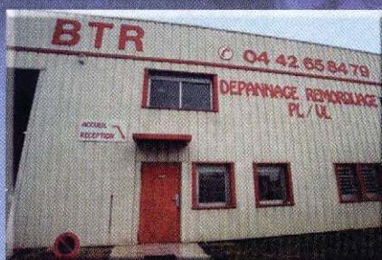
Propriétaire des locaux, les frères Barthélémy ont fait construire leur bâtiment.