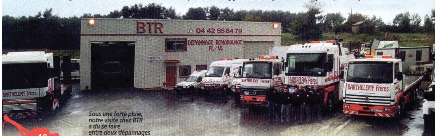
Sous une forte pluie, notre visite chez BTR a dû se faire entre deux dépannages

La relève est donc assurée par cette nouvelle génération qui doit tout à ses pères, mais qui a la lourde tâche