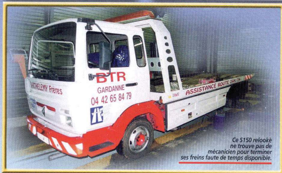
Ce S150 relooké ne trouve pas de mécanicien pour terminer ses freins faute de temps disponible.

par un fixe complété par un pourcentage, comme il est d'usage dans notre profession. La prochaine extension des locaux par l'acquisition d'un terrain de 3 200 m 2 ne fera que confirmer l'implantation de la société basée à Gardanne, à 25 kilomètres du centre de Marseille, en plein cœur des échangeurs d'autoroutes. Côté matériels, tous les équipements sont fabriqués chez OMARS, proche de la frontière Italienne. Le représentant