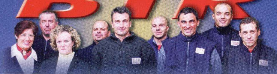
Cette jeune équipe de professionnels inspire la bonne humeur du midi

A vec cette dernière, spécialisée poids lourds, un véritable partenariat s'est mis en place. Régulièrement, des collaborateurs de Service 24 se déplacent chez BTR pour évaluer et synchroniser les interventions délicates. Le bon fonctionnement d'une entreprise relevant en premier lieu d'un personnel motivé, le montant des salaires est l'une des clés de la réussite de BTR. Les compagnons sont rémunérés