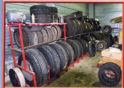
bonbonne d'air sur le rack permettant de gonfler en une seconde un pneu fraîchement monté sur sa jante.

Le pneumatique est une activité essentielle pour le dépannage poids lourds. Remarquez la petite